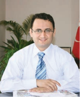
Mahmut KAÇAR Sağlık-Sen Genel Başkanı