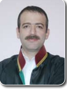
Av. Serkan GÜÇLÜ SAĞLIK-SEN Hukuk Müşaviri