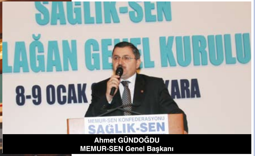
Ahmet GÜNDOĞDU MEMUR-SEN Genel Başkanı